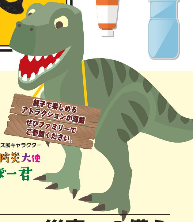
防災グッズ展キャラクター

※2019年5月1日に、国連国際防災戦略事務局(UNISDR)は国連防災機関(UNDRR)に名称変更しました。